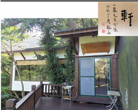
荒堂旁側的二寄軒